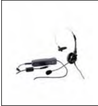
Mono USB headset:

Mono USB headset met audiocontrole op de kabel. Erg goede kwaliteit voor spraakherkenning. Lichtgewicht en met een lange kabel naar de computer. Cedere adviseert deze digitale headset.